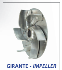
GIRANTE - IMPELLER